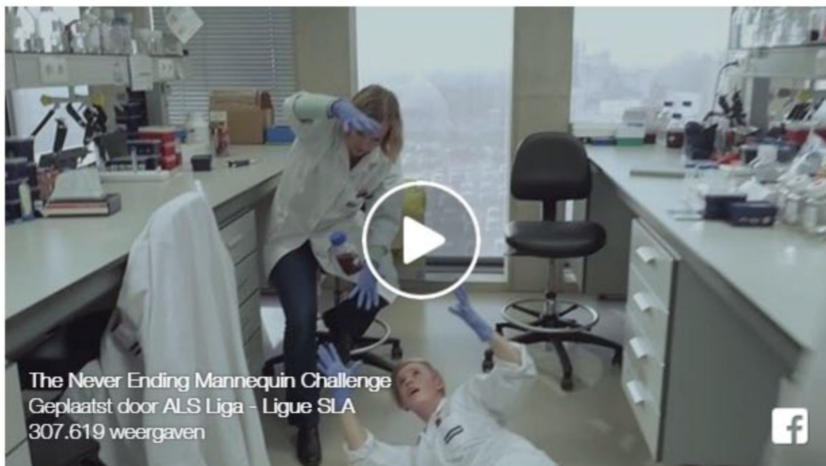
The Never Ending Mannequin Challenge Geplaatst door ALS Liga - Ligue SLA 307.619 weergaven

Con este video, la Asociación de ALS (en inglés) desea recaudar dinero para poder ayudar a estas personas que padecen de esta enfermedad. Para más información: https://als.be/