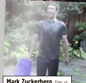
Mark Zuckerberg.