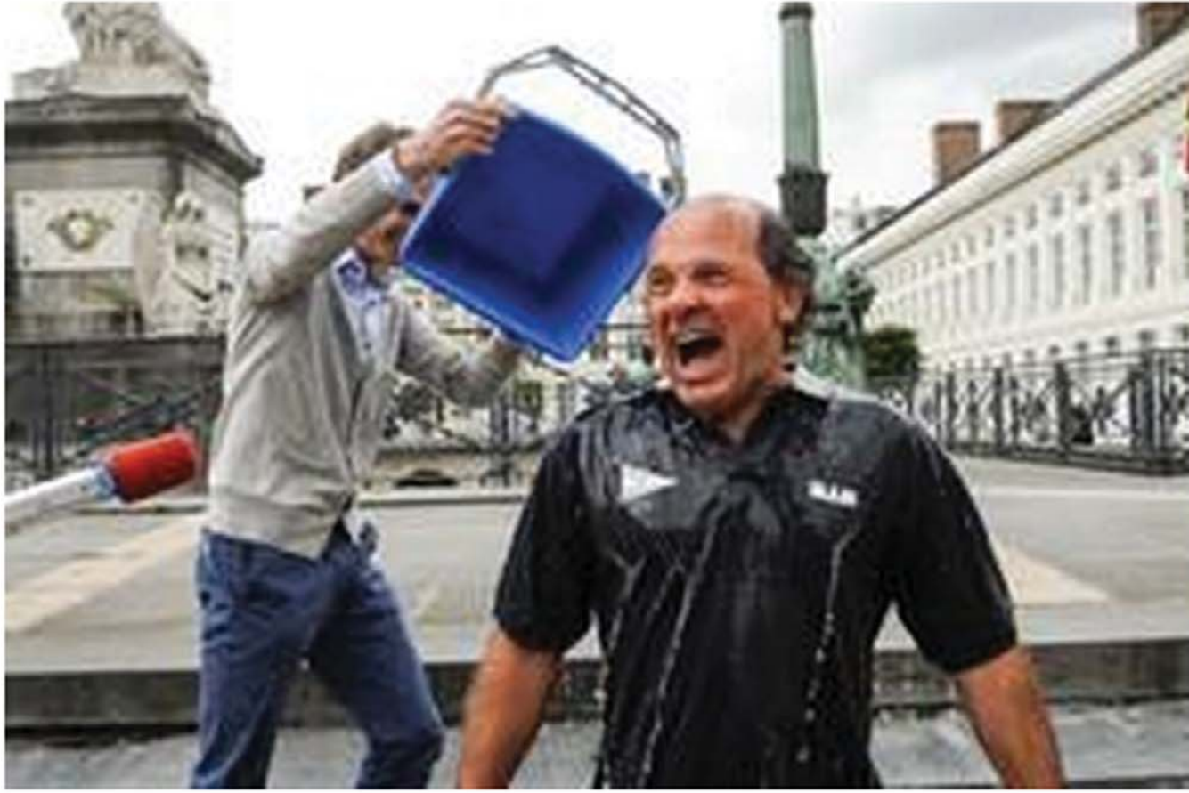
Onder meer Vlaams minister Muyters ging de uitdaging aan.

De ALS Ice Bucket Challenge heeft sedert 12 augustus voorlopig al 123.000 euro opgeleverd aan de ALS Liga België. Dat maakte de vzw zondagavond bekend op haar website.