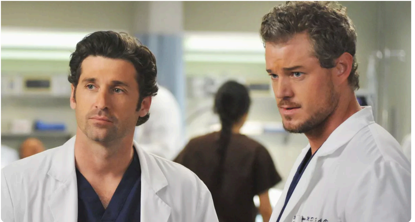
Eric Dane (rechts) als dokter Mark ('McSteamy') Sloan in 'Grey's Anatomy', naast Patrick Dempsey, alias dokter Derek 'McDreamy' Shepherd.

Het personage van Mark Sloan was knap, flamboyant en charmant. In zijn eerste aflevering stapte hij uit de douche, enkel bedekt met een spierwitte handdoek. De vrouwelijke artsen in het ziekenhuis doopten hem vervolgens 'McSteamy', een bijnaam die altijd is blijven hangen.